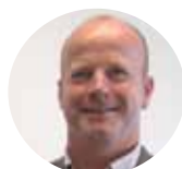
Lars Eklund Butikerna